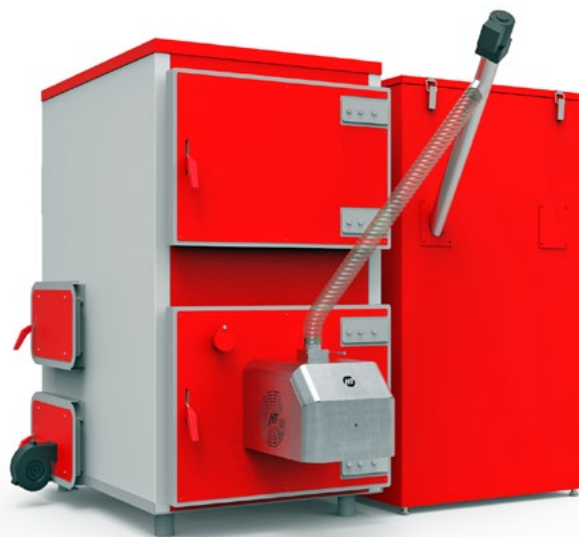
MAXPelL DUO 300

Kocioł w części pracy palnika pelletowego może być wyposażony w system automatycznego odpopielania.