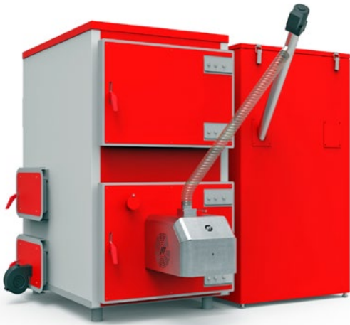
MAXPELL DUO 100 - 300 kW