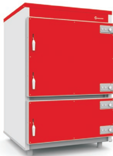
Q PLUS AGRO 50

Kotły AGRO wyposażone są w automatykę HT-tronic® 251 .