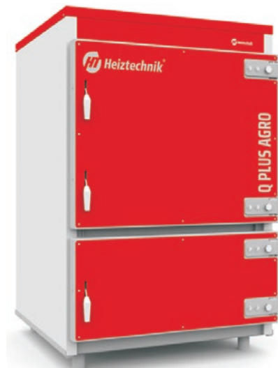
Q PLUS AGRO 50

Automatyka steruje pracą bufora. Usprawnia to proces spalania i umożliwia gromadzenie energii cieplnej.