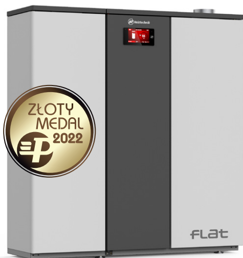
FLAT 11 kW