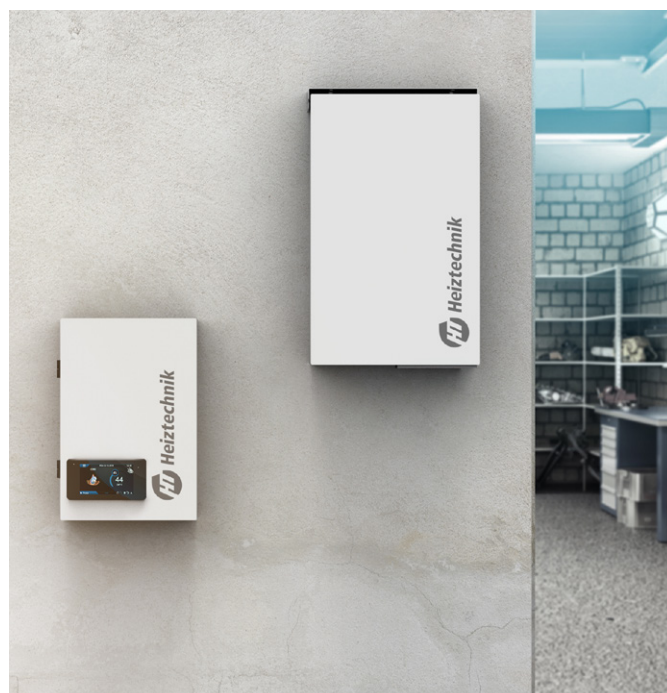
CALLA VERDE M CALLA VERDE S 14 - 20 kW